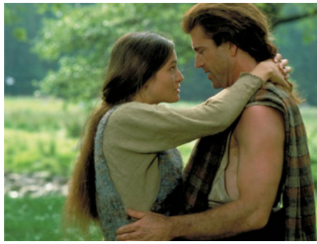
1995 BRAVEHEART (Braveheart) de Mel Gibson avec Mel Gibson