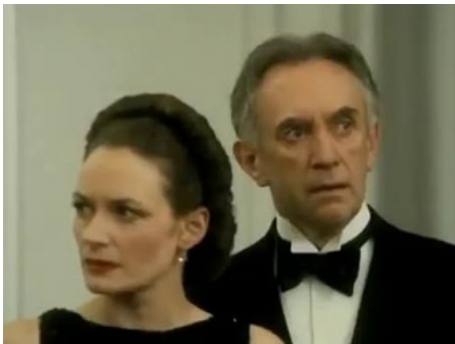
2007 THE MOON AND THE STARS de Peter O'Fallon avec Jonathan Pryce