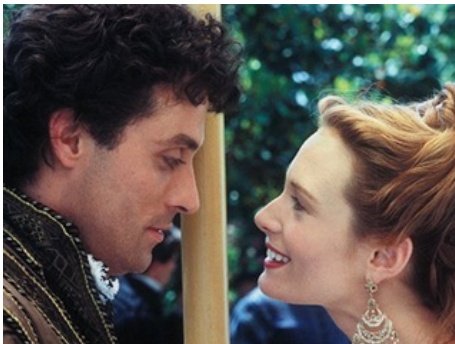
1998 LA COURTISANE (Dangerous Beauty) de Marshall Herskovitz avec Rufus Sewell