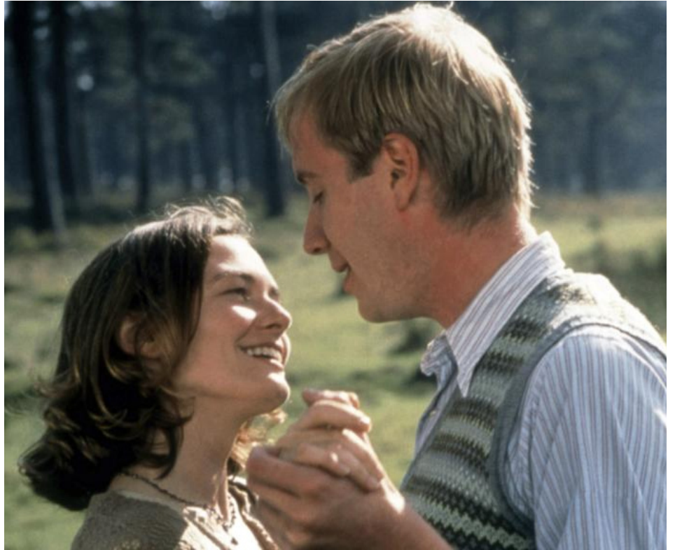
1998 LES MOISSONS D'IRLANDE (Dancing at Lughnasa) de Pat O'Connor avec Rhys Ifans