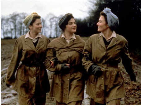
1998 TROIS ANGLAISES EN CAMPAGNE (The Land Girls) de David Leland avec Rachel Weisz, Anna Friel