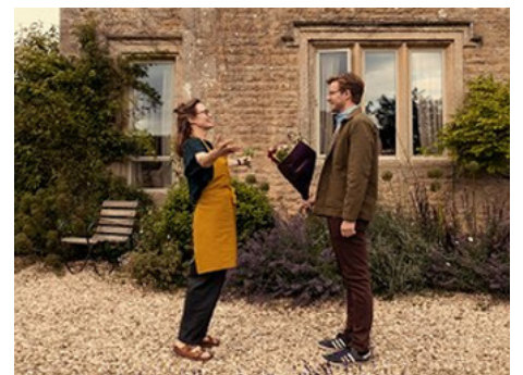
2022 SLOW HORSES de Jeremy Lovering avec Jack Lowden