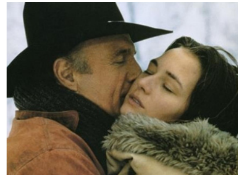
1996 GRAND NORD (North Star) de Nils Gaup avec James Caan