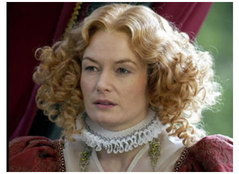
2004 GUNPOWDER (Gunpowder, Treason & Plot) de Gillies MacKinnon