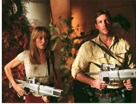
2005 UN COUP DE TONNERRE (A Sound of Thunder) de Peter Hyams avec Edward Burns