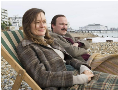
2013 LUCAN (Lucan) d'Adrian Shergold avec Rory Kinnear