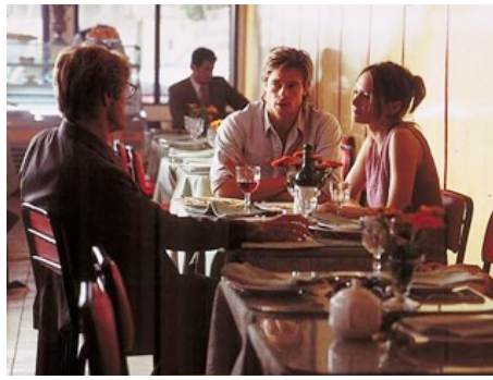
2001 SPY GAMES, JEU D'ESPIONS (Spy Games) de Tony Scott avec Robert Redford, Brad Pitt