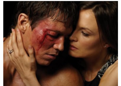
2011 LIGHTS OUT (Lights Out) de Norberto Barba & Clark Johnson avec Holt McCallany