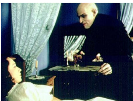
2000 L'OMBRE DU VAMPIRE (Shadow of the Vampire) d'E. Elias Merhige avec Tim Roth