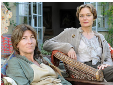
2015 LIFE IN SQUARES de Simon Kaijser avec Eve Best