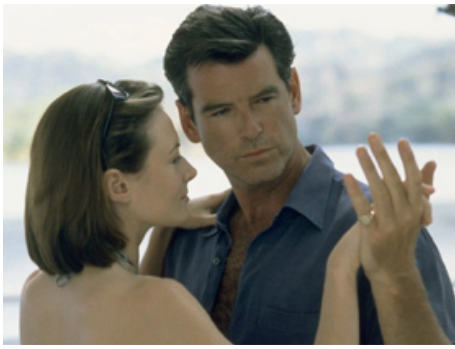
2001 LE TAILLEUR DE PANAMA (The Tailor of Panama) de John Boorman avec Pierce Brosnan