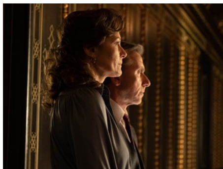
2019 LE PRODIGE INCONNU (The Song of Names) de François Girard avec Tim Roth