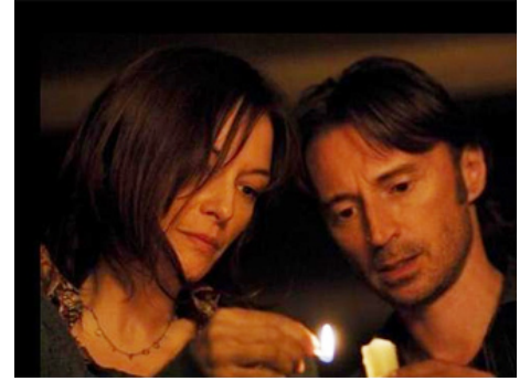
2007 28 SEMAINES PLUS TARD (28 Weeks Later) de Juan Carlos Fresnadillo avec Robert Carlyle