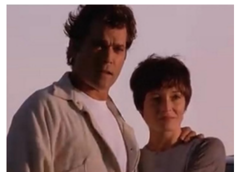
2000 LE MURMURE DES ANGES (A Rumor of Angels) de Peter O'Fallon avec Ray Liotta