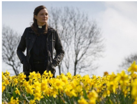
2013 THE FOLD (The Fold) de John Jencks