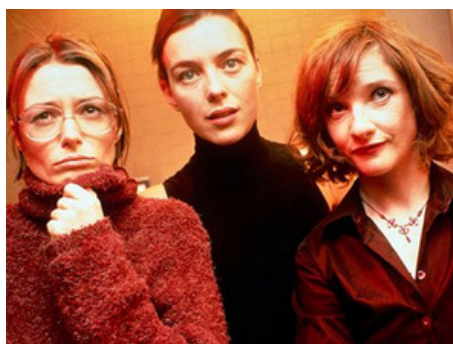
2000 BORN ROMANTIC (Born Romantic) de David Kane avec Olivia Williams, Jane Horrocks