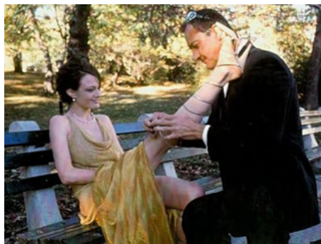
1999 THE DEBTORS d'Evi Quaid avec Randy Quaid